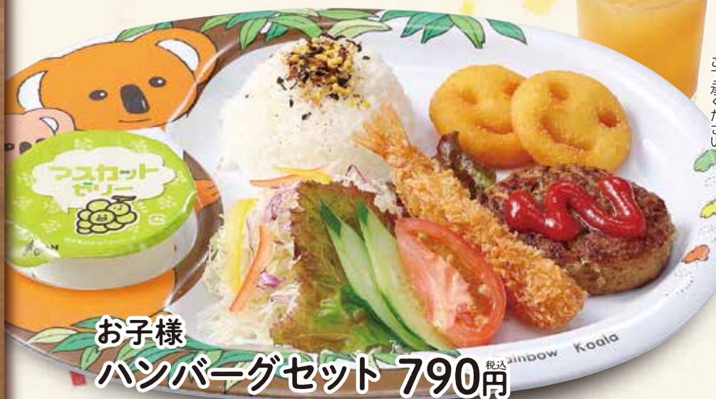
お子様 ハンバーグセット 790円 税込